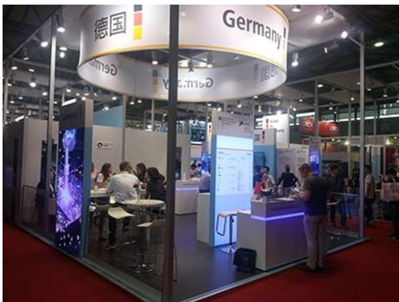
Der German Pavilion auf der BEWC präsentierte sich in neuer Optik.