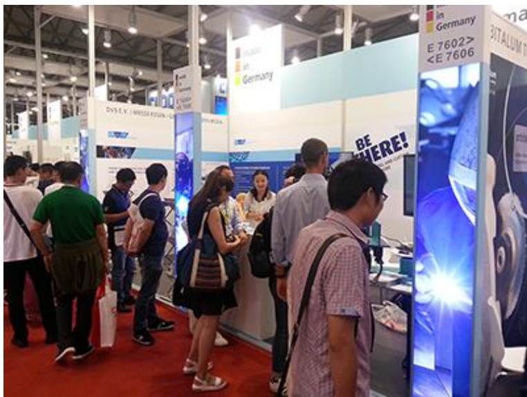
Im neuen, blauen Look: Der DVS-Gemeinschaftsstand auf der BEWC 2017.