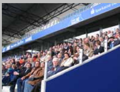
Gute Stimmung auf der Tribüne: Die DVS-Mitglieder und Gäste bei der Besichtigung der MSV-Arena

Fans darunter, die sich diese Gelegenheit nicht entgehen lassen wollten. So gehörte denn auch zum Rahmen der Veranstaltung vor Beginn der eigentlichen Mitgliederversammlung eine Führung durch alle Bereiche des Stadions. Besondere