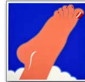
Tom Wesselmann , Foot, 1968 © The Estate of Tom Wesselmann; VG Bild-Kunst, Bonn 2015