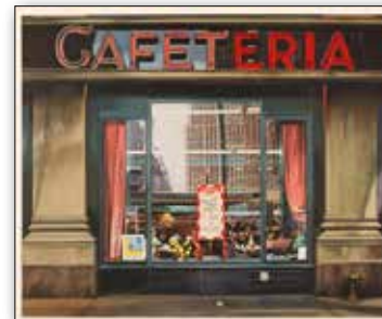
Richard Estes , Cafeteria, 1970 © Richard Estes, Courtesy Marlborough Gallery, New York

Besuchen Sie uns doch mal auf unserer Homepage: www.bv-duisburg.de