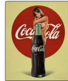
Mel Ramos , Coke, 1972 © VG Bild-Kunst, Bonn 2015