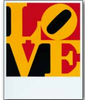
Robert Indiana , LOVE, 1967 © Morgan Art Foundation; ARS, New York; VG Bild-Kunst, Bonn 2015