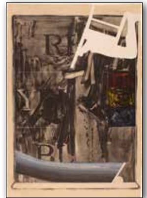
Jasper Johns , Watchman, 1967 © VG Bild-Kunst, Bonn 2015