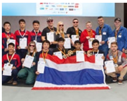
Das Team Thailand (vorne) gewann die "International Welding Competition" auf der SCHWEISSEN & SCHNEIDEN 2017.

Gute Nachrichten für das kommende Jahr: Bereits sieben Nationen haben ihre Teilnahme an der International Welding Competition zugesagt.