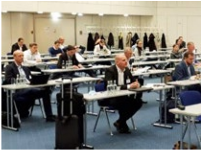
Tagung zur Additiven Fertigung mit Mindestabstand.

Mit gleich zwei neuen Veranstaltungsformaten und einem sorgfältig geplanten Hygienekonzept präsentierte sich der DVS live in der Messe Essen: Additive Fertigungsverfahren zum formgebenden Schweißen waren das zentrale Thema einer Tagung und einer gemeinschaftlichen Sitzung ausgewählter DVS-Forschungsgremien.