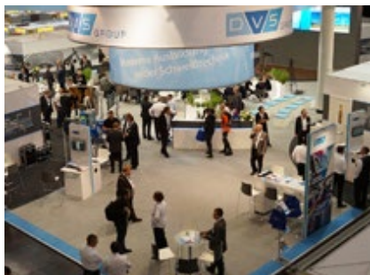
Der DVS-Gemeinschaftsstand auf der SCHWEISSEN & SCHNEIDEN 2017.

In noch nicht einmal einem Jahr ist es wieder soweit, dann heißt es: Let's join the World! Die Weltleitmesse SCHWEISSEN & SCHNEIDEN öffnet in der neuen Messe Essen vom 13. bis 17. September 2021 zum 20. Mal ihre Tore. Noch kann zwar keiner voraussehen, welche Vorgaben dann für die Durchführung einer Messe gelten, aber die Vorbereitungen für den internationalen Treffpunkt der Branche laufen auf Hochtouren.